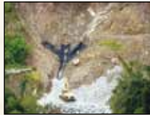
Intentan mitigar, 2007