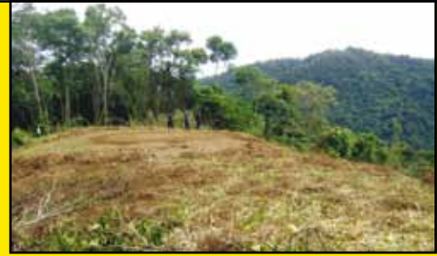
Vecinos denunciaron la deforestación que se realizó cerca del cerro Sukut para contruir una pista clandestina de helicópteros.

La presente crisis económico-financiera global debe hacernos reflexionar acerca de cuáles son las actividades importantes en el proceso de desarrollo nacional con la finalidad de tomar decisiones en favor de aquellas actividades sostenibles que favorezcan la inversión local, el ambiente en el largo plazo y que redunden en beneficios para la sociedad en su conjunto.